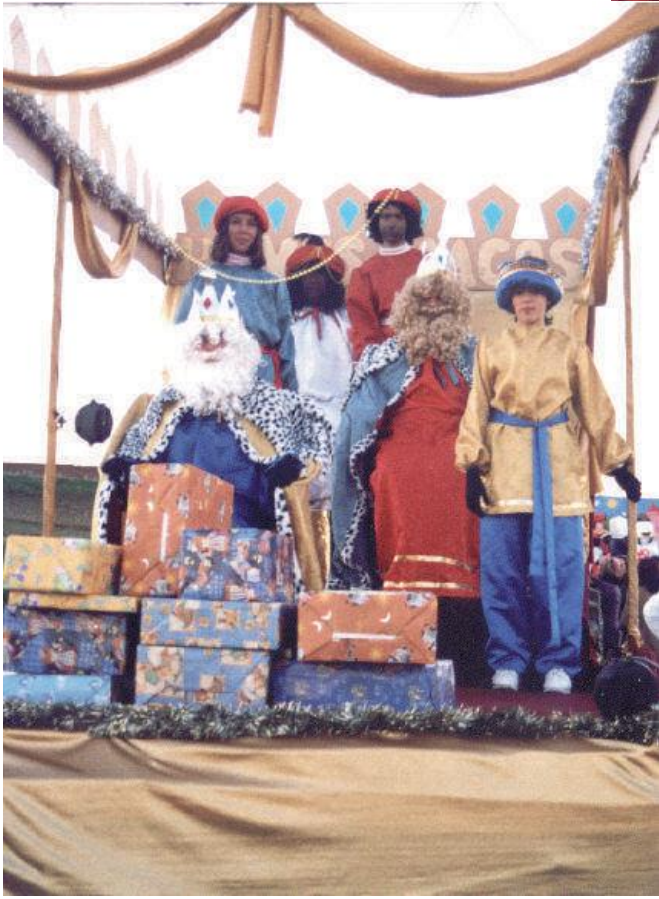
Carrozas año 2003