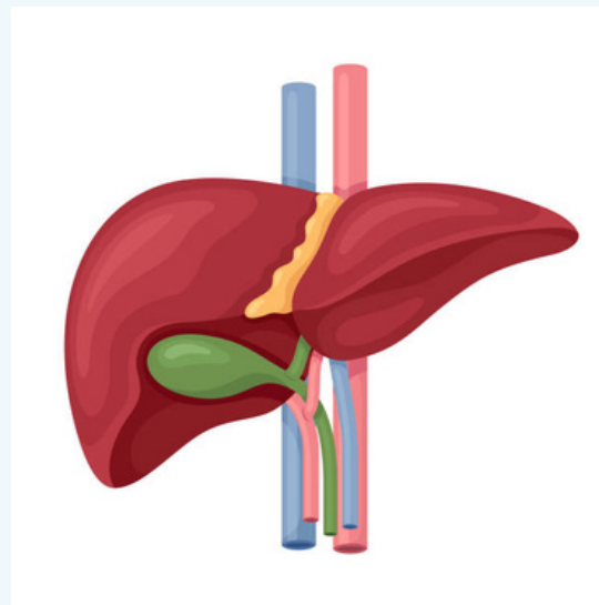
Problemas de hígado