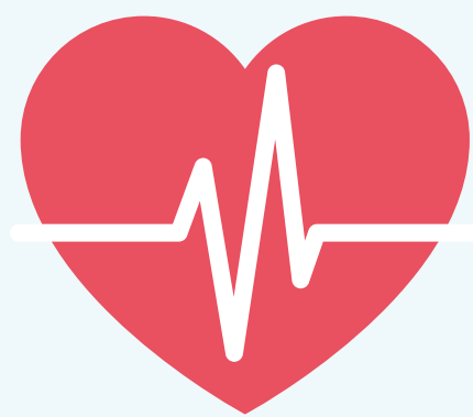
Enfermedad de corazón