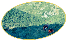
SANTA MAGDALENA DE POLPÍS

La botànica ho impregnarà tot al llarg d'aquesta agradable ruta interpretativa. La fortalesa templera de Peníscola, d'ancestrals orígens, eclipsa els altres castells costaners de la zona, com el de Polpís. D'origen musulmà i ampliacions cristianes, s'alça orgullós entre ombrívols barrancs amb vegetació selvàtica. Per a acabar, acomiadarem la ruta saludant a algunes de les monumentals garroferes del terme de Santa Magdalena.