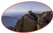
VISTABELLA DEL MAESTRAT