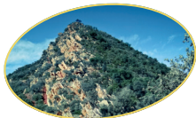
NULES I LA VILAVELLA

Quan acabem aquesta sorprenent ruta haurem recorregut els contraforts de la serra d'Espadà al voltant dels puntals principals de la qual (Font de Cabres, Creu de Ferro) s'estén una sureda montana d'ombria i un patrimoni geològic de rodeno excepcional. Després de visitar diverses fonts històriques trobarem importants restes del patrimoni bèl·lic de l'última guerra civil espanyola. Entre trinxeres i nius de metralladora acomiadarem una ruta com a poques a la província.