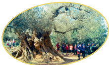
CANET LO ROIG

No existeix a Europa tan gran quantitat d'arbres mil·lenaris com la de la mar d'oliveres del Baix Maestrat. Els arbres que, empeltats des de temps dels ibers, continuen donant el seu millor fruit hui dia després d'haver superat incendis, gelades, sequeres... Recorrerem el mosaic de la tríada mediterrània travessant rouedes relictas, visitant fonts com la romana del Vilagròs o el musulmà Aljub. Cal veure per a creure!