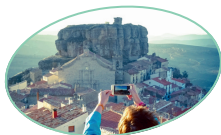
ARES DEL MAESTRAT