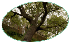
LA SERRA D'EN GALCERAN

A la Serra d'en Galceran tot són sorpreses, com el seu pou de neu situat en ple nucli urbà. Des d'ací, envoltarem la Mola passant pels seus vessants de solana i ombria i gaudint de les vistes a diversos parcs naturals. A meitat de ruta, una altra sorpresa seran les restes del poblat iber d'Els Castellàs, i ja al final, envoltats de vegetació frondosa amb alts requeriments d'humitat, el roure valencià monumental que ja va descriure Cavanilles fa més de 200 anys serà el comiat perfecte.