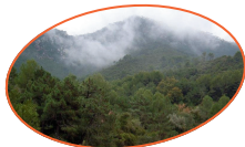
CABANES I BENICÀSSIM