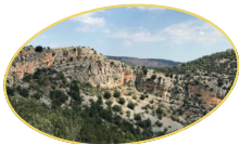
PORTELL DE MORELLA