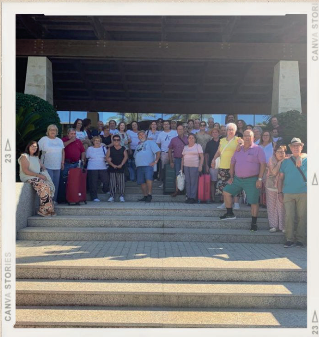
FANTÁSTICO VIAJE A ISLANTILLA