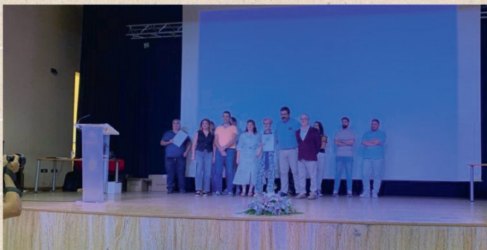
CLAUSURA DE LA ESCUELA PROFESIONAL DUAL DE LA MANCOMUNIDAD INTEGRAL DE SERVICIOS " LA SERENA-VEGAS ALTAS "