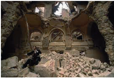
Vedran Smailović tocando en Biblioteca Nacional de Sarajevo, en 1992

El incendio de 1992 destruyó centenares de miles de libros y numerosos incunables. Varios miles de volúmenes pudieron ser salvados en los primeros momentos del incendio, cuando los empleados de la biblioteca, arriesgando sus vidas, comenzaron a arrojar libros y documentos por las ventanas. [...] Las bombas incendiarias no sólo habían destruido centenares de miles de libros, sino que habían corroído las columnatas del edificio, acabado de construir en 1894, con una mezcla de estilos orientalizantes, cuando la ciudad ya no se hallaba bajo dominio otomano y formaba parte del Imperio austrohúngaro. [La Vanguardia: El hombre que incendió la biblioteca de Sarajevo]