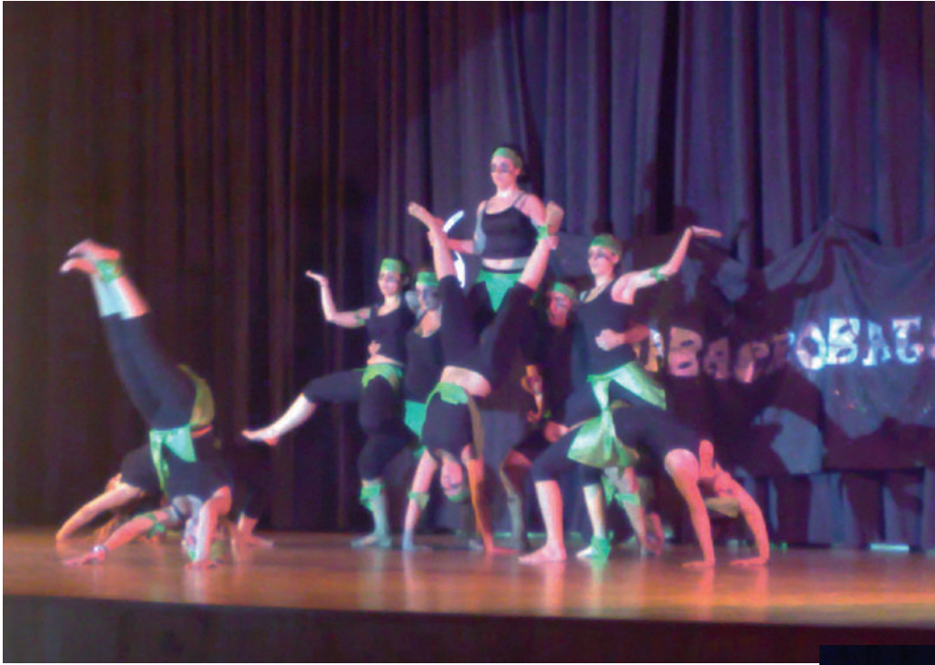
Artistas locales. Fotos de los archivos del ayuntamiento.