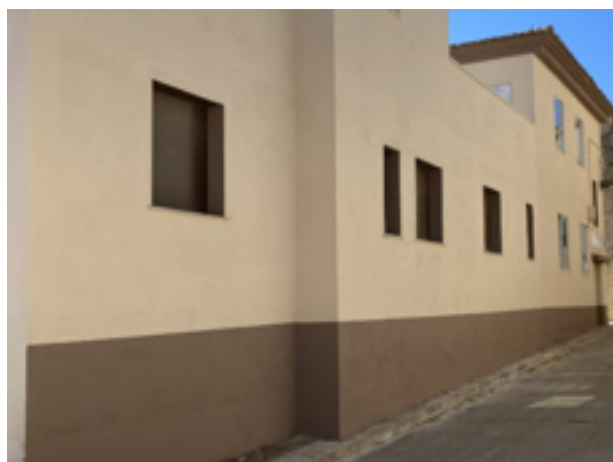
Pintura turismo rural “Casa Bergallo”