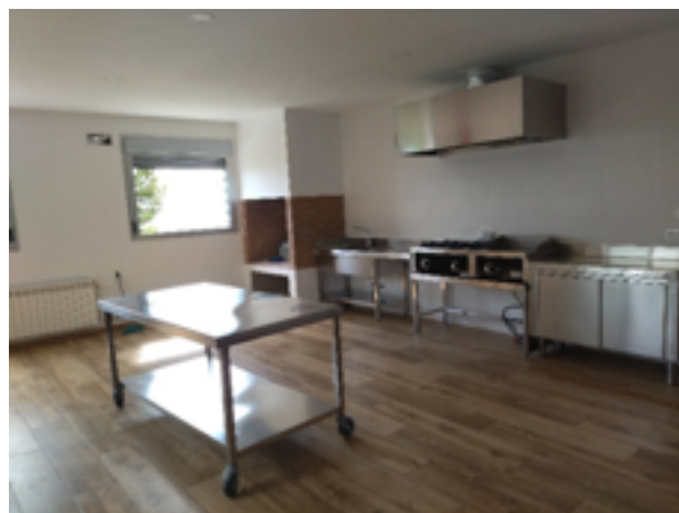
Cocina Club Social