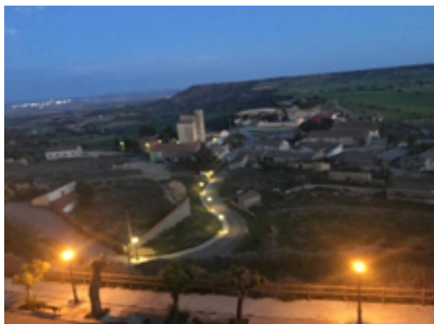
Alumbrado Camino Silo