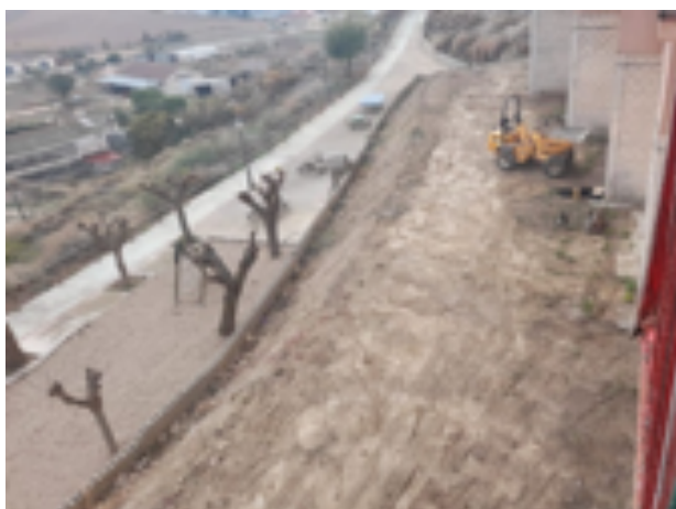
Acondicionamiento zona piscinas