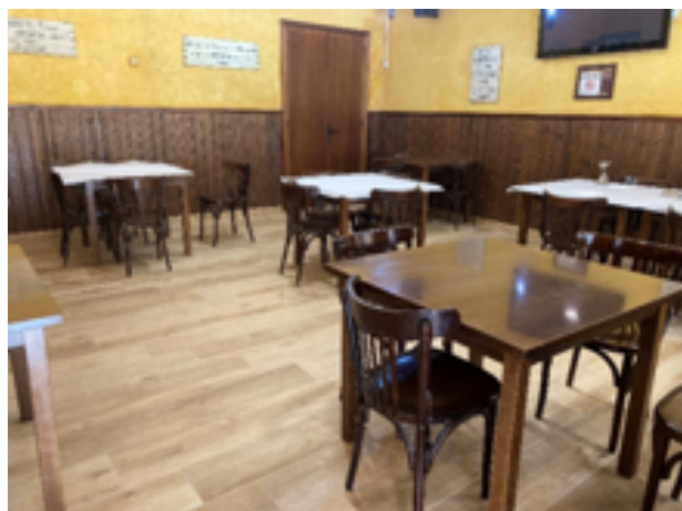
Reforma Bar Meridiano