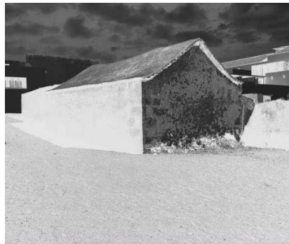
El negro es un color - Fundación Canal y PHotoESPAÑA