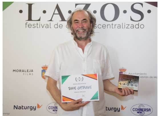
Gala de clausura