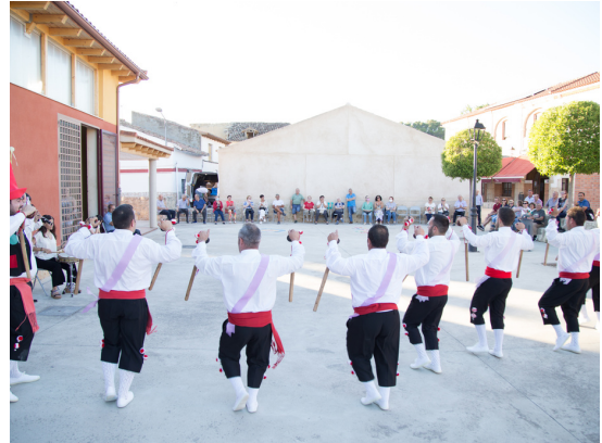
Extensión de actividades en San Cebrián de Mazote