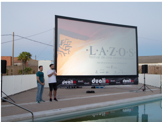
Proyecciones en las piscinas municipales de Castromonte