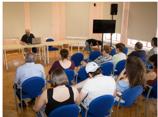
Ponencias y talleres organizados con la UVA