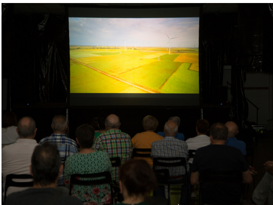
Proyecciones en la sala 'Paneras' en Castromonte