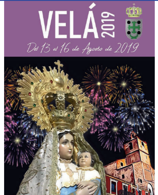
Imagen de la Virgen de La Antigua Escudo Oficial del Ayuntamiento El texto: 'Del 13 al 16 de Agosto'.

Plazo de recepción de portadas hasta el 15 de Julio