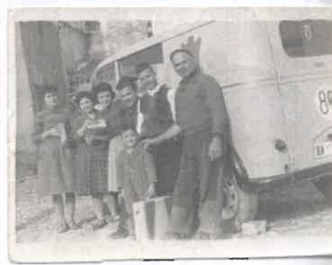
Matanza Año 1959-1960 Anónimo