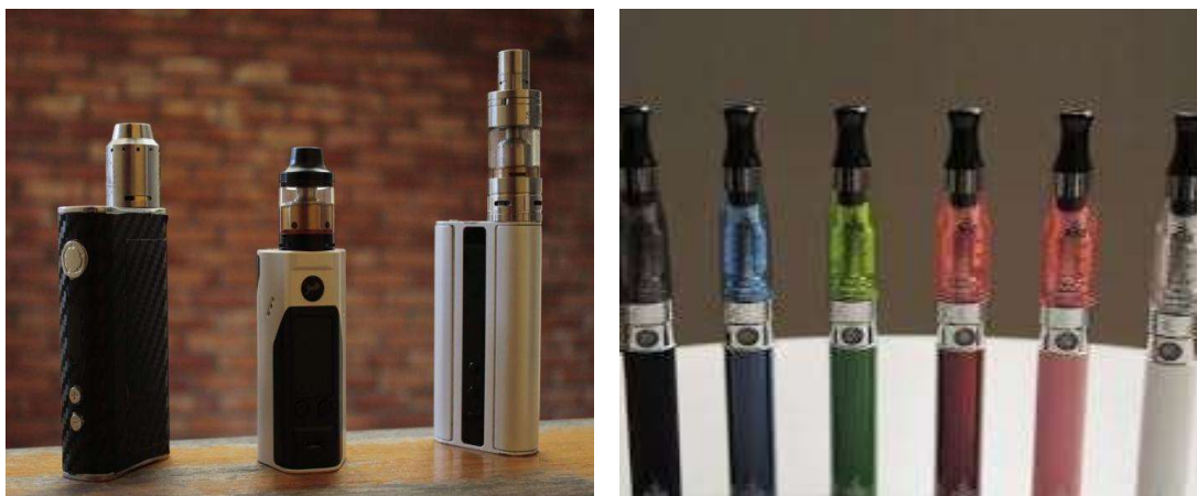
Figura 2. Diferentes modelos de cigarrillo electrónico