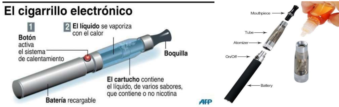
Figura 1. El cigarrillo electrónico y sus componentes

Consisten en un pequeño depósito o cartucho (que contiene el líquido con o sin nicotina, propilenglicol, saborizantes y otros compuestos químicos), en el que mediante un sistema electrónico con una batería recargable y un atomizador se vaporiza la mezcla. Se utiliza inhalando el aerosol producido simulando los cigarrillos tradicionales (hecho conocido popularmente como “vapeo” o “vapear”).