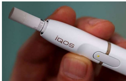
Figura 5: Dispositivo de calentamiento de tabaco con cigarrillo stick insertado

De este modo, el dispositivo electrónico de calentamiento y el cigarrillo “stick” componen una unidad funcional única, al ser imposible su funcionamiento de manera independiente.