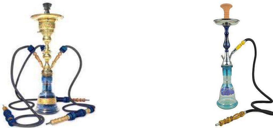
Figura 7: Pipa de agua

Se trata de una especie de jarrón con una cazoleta, un cuerpo de metal, una manguera y un recipiente de agua (figura 7). Su forma de funcionar es por la combustión del carbón sobre el tabaco cubierto con papel aluminio. El humo se produce a medida que se va calentando el tabaco. Posteriormente este humo pasa por el agua para enfriarse antes de que la persona inhale 2 .