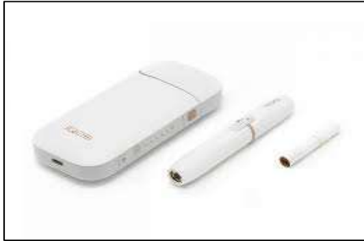
Figura 4: Componentes de PTC