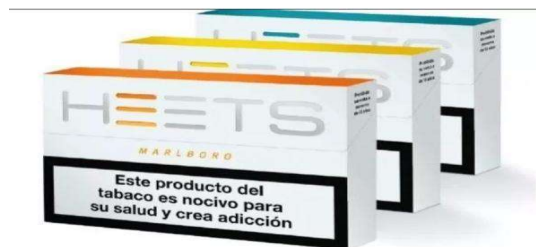
Figura 6: Etiquetado cigarrillos para PTC

1. En las unidades de envasado y en el embalaje exterior de los productos del tabaco sin combustión figurará la siguiente advertencia sanitaria: «Este producto del tabaco es nocivo para su salud y crea adicción».