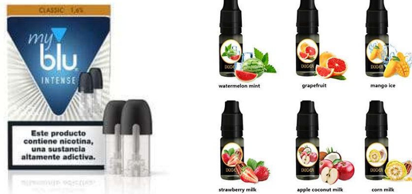
Figura 3. Envases de recarga de líquidos para el cigarrillo electrónico, con y sin nicotina (sabores frutas)

EL CIGARRILLO ELECTRÓNICO o DSLN, NO ESTÁ CATALOGADO COMO UN “PRODUCTO DE TABACO”, SINO COMO UN “PRODUCTO RELACIONADO CON EL TABACO” POR SU CONTENIDO EN NICOTINA Y LE ES DE APLICACIÓN LOS ARTÍCULOS CORRESPONDIENTES DE LA LEY 28/2005 Y SUS MODIFICACIONES.