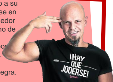
Cesar P. Gellida

El autor vallisoletano decidió dar un giro a su carrera profesional en 2011 dedicándose en exclusiva a la escritura. Ha sido merecedor de numerosos premios como el "Racimo de oro de Literatura" o premio a la mejor novela negra por "Todo lo peor" en el festival Valencia Negra 2019. Gellida se ha convertido en un autor imprescindible si hablamos de novela negra.