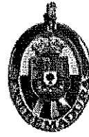
Medalla Extremadura 1994

HERMANDAD DE DONANTES DE SANGRE "VIRGEN DE ARGEME" CORIA Y COMARCA C/ Cervantes, 75 - 10800 CORIA (Cáceres)