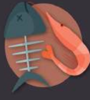
espinas y restos de pescado y marisco