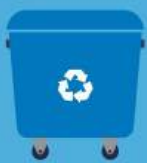
Envases de papel y cartón