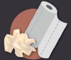
papel de cocina, pañuelos y servilletas sucios