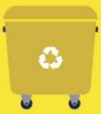
Envases de plástico, latas y briks