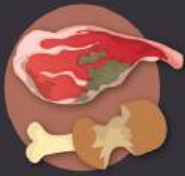
huesos y restos de carne