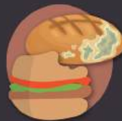
restos de pan y otras comidas