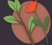
restos de poda y de jardinería domiciliarios