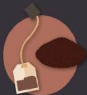
restos de café e infusiones