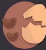
cáscaras de huevo y de frutos secos