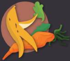
pieles y restos de fruta y verdura