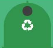
Envases de vidrio