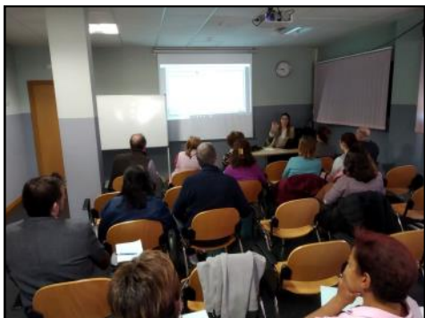
Se ofreció a los vecinos una charla sobre la sede electrónica, certificado digital y la factura electrónica