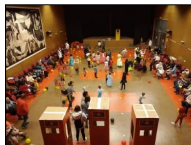
La fiesta de carnaval nos trajo muchas sorpresas de la mano de Harry Potter, el mago Pablo Potter y todas las actividades organizadas