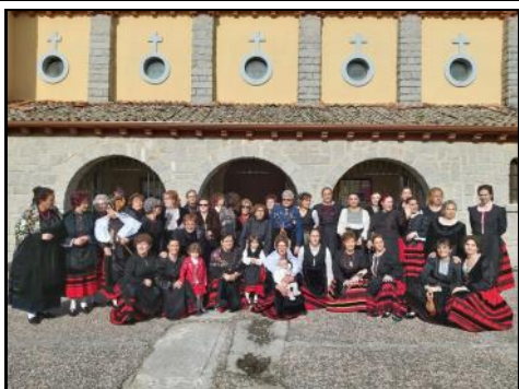
Se celebró la festividad de Santa Agueda, esta vez con la participación de la Escuela Municipal de Jotas