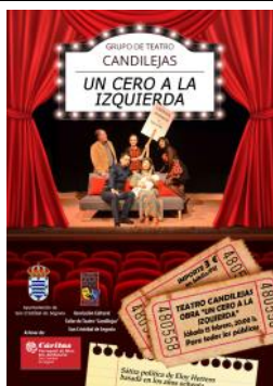
Éxito del grupo de teatro Candilejas, esta vez con un fin benéfico