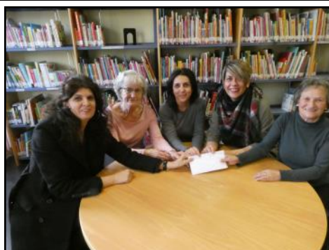
Se hizo entrega de lo recaudado en la obra de teatro a favor de Cáritas Parroquial de San Cristóbal de Segovia