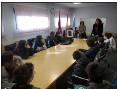
Dio comienzo el curso de técnicas de estudio para alumnos de secundaria como apuesta municipal por el estudio