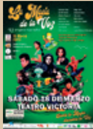
LA MAGIA DE LA VOZ EL ESPECTÁCULO