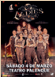
LADIES FOOTBALL CLUB