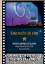
CONCIERTO "UNA NOCHE DE CINE"