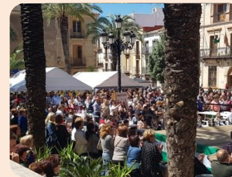
RESTAURANTE LA ALACENA

19:30h- Fiesta Flamenca y Gastronómica de la Asociación Tertulia Flamenca en Honor a la Virgen de la Estrella