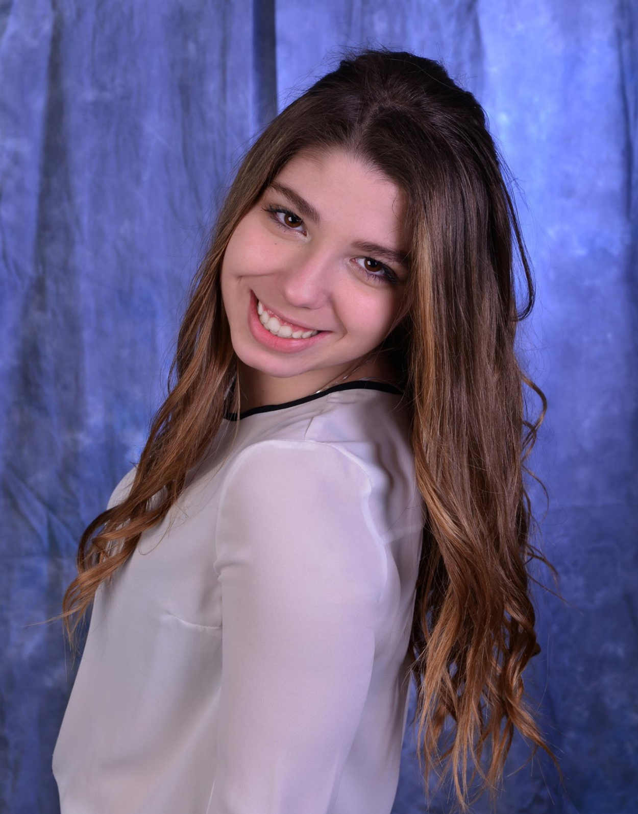
CORTÉS SÁNCHEZ RUEDA DAMA DE HONOR