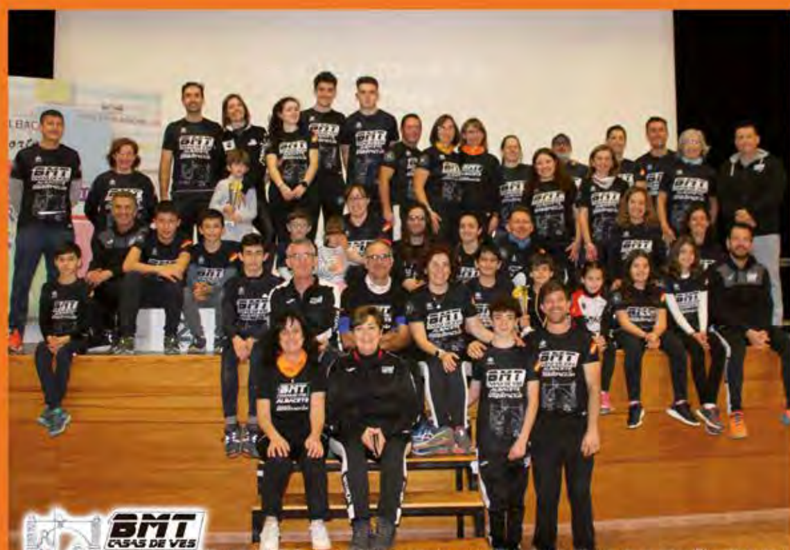
El club BMT Casas de Ves continúa en la División de Honor de la Liga Española de Orientación y en la temporada 2022 finalizó en el puesto 11º