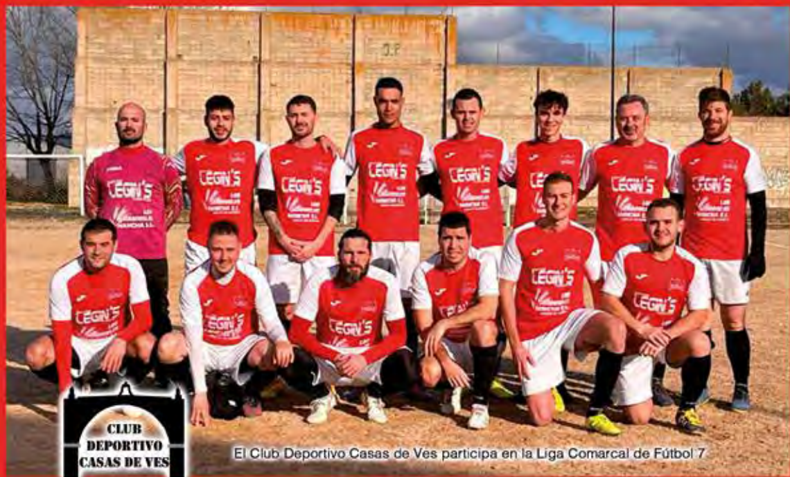
El Club Deportivo Casas de Ves participa en la Liga Comarcal de Fútbol 7