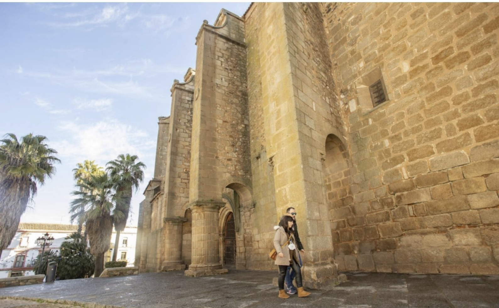
Imagen de la Plaza de Santiago, el pasado martes a mediodía.

El frío reduce la presencia de personas conflictivas y la Policía destaca el descenso de la inseguridad tras los altercados del verano