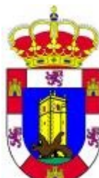
ALDEA DEL CANO