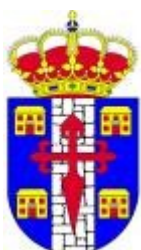
CASAS DE DON ANTONIO