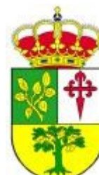
ZARZA DE MON- TANCHEZ

PUEDES TENER MÁS INFORMACIÓN DE CADA MUNICIPIO HACIENDO CLIC EN SU ESCUDO PARA ACCEDER A SU WEB Y EN SU NOMBRE PARA ACCEDER A SU BANDO MOVIL