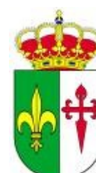
SALVATIERRA DE SANTIAGO