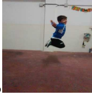
A pies juntos llevando los talones al culo