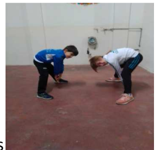
Delante, centro y atrás