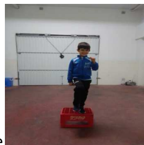
Subir a una altura y bajar saltando con un pie