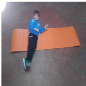
Croqueta o voltereta