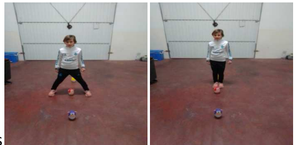
Salto abriendo y cerrando piernas entre marcas