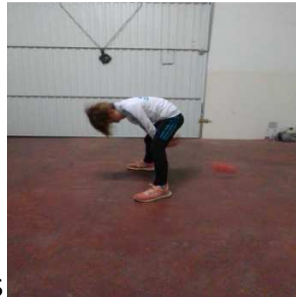
Entre las piernas hacia atrás

Ahora usaremos una pelota tamaño tenis más o menos y de un material con el que busquemos la misma premisa de que no rompamos nada.