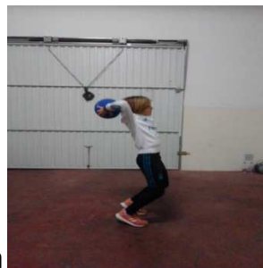
A dos manos por encima de la cabeza

Necesitaremos una pelota, del tamaño de una de fútbol más o menos, y que sea de peluche o plástico o incluso un globo (la idea es que evitemos romper algo), y l@s peques la lanzaran al adulto que les acompaña o herman@ que quiera participar.