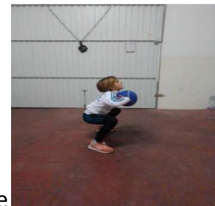
Agachados, saltamos y lanzamos con dos manos hacia delante