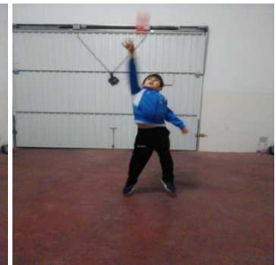
Con una mano hacia arriba, ambas manos