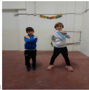
Giros de molino sin mover cabeza