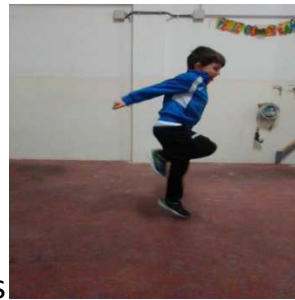
Pata coja con talón en el culo, ambas piernas