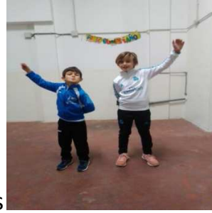
Giros de molino adelante y atrás, con un brazo y con dos