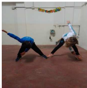
Tocar pie con mano contraria