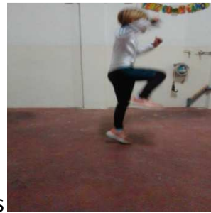
Pata coja con rodilla por delante, ambas piernas