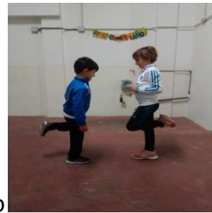
Talones al culo