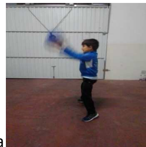
De espaldas con dos manos y por encima de la cabeza