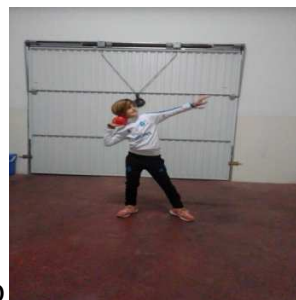
Lanzamiento normal de peso