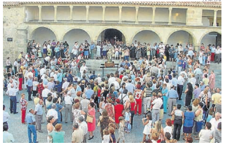
► Vecinos del municipio congregados en torno a la Virgen de Sopetrán.

ACTOS TAURINOS // Como parte de las fiestas no pueden faltar los tradicionales eventos taurinos que se organizan para disfrute de vecinos y visitantes. El jueves a las 23.30 horas tendrán lugar las tradicionales Vaquillas Del Apagón. Como bien saben los vecinos se sacará la vaquilla y acto seguido se apagarán las luces; desde luego, emoción asegurada. El último día de fiestas, viernes 17, la jornada comienza a las 12.00 de la mañana con el encierro infantil. Un divertido evento que coincide con la fiesta de la espuma para que los más pequeños puedan disfrutar al mismo tiempo que combaten el calor. A las 19.00 horas dará comienzo la novillada con un cartel que promete un buen espectáculo: Pablo Páez, de la escuela taurina de Sevilla, Samuel Fernández, de Toledo y Alejandro Márquez de la escuela taurina de Cáceres, serán los encargados de torear a los novillos y armar el taco. Un evento que condensa mucha expectación y en resumen, actos taurinos a la altura de estas fiestas. ≡