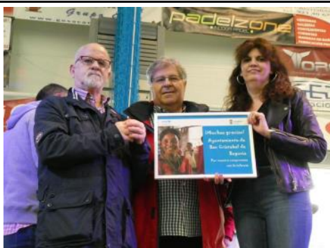
Unicef reconoció al Ayuntamiento su labor por la Infancia y la adolescencia