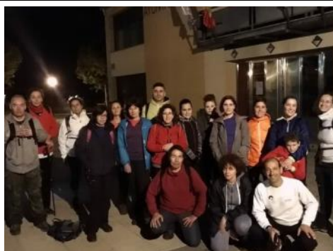
La marcha de las estrellas congregó a un buen puñado de caminantes que lo dieron todo