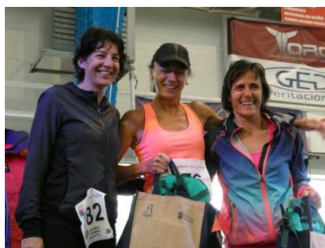
La VIII carrera y II marcha benéficas demostraron que la ilusión no pudo con la lluvia. Más fotos en https://goo.gl/nzZvsY