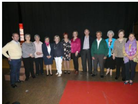
El club de poesía de San Cristóbal debutó con éxito