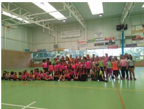
La escuela Municipal de Música y Danza realizó sus festivales finales de curso