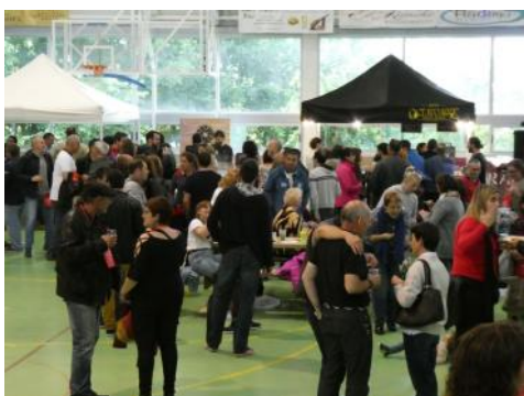
Se celebró la III feria de la cerveza artesana con éxito de público, el día 9 de junio en el pabellón