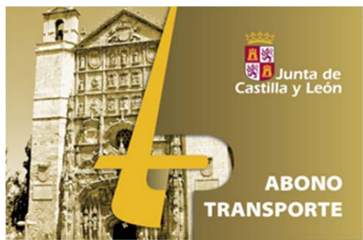
ABONO TRANSPORTE ESPECIAL