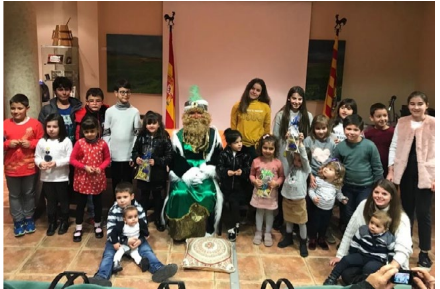
Imagen de los niños y niñas que asistieron el año pasado al encuentro con el paje