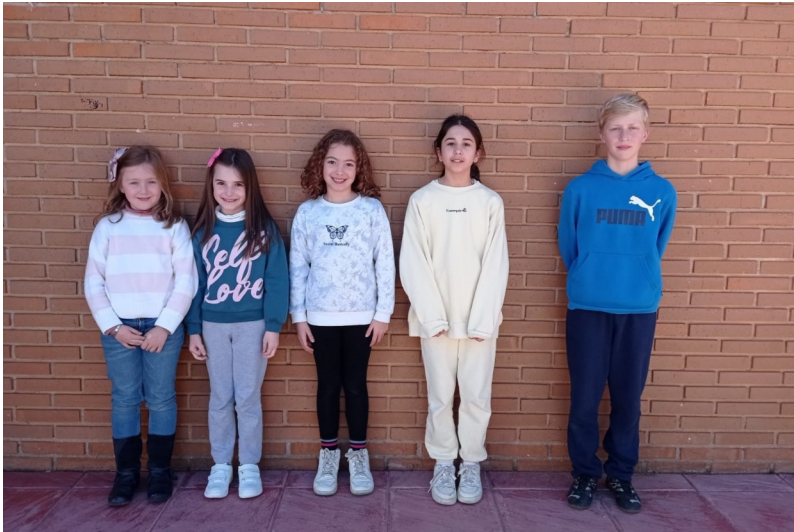
Algunos de los premiados

Enhorabuena a todos y Feliz Semana Santa