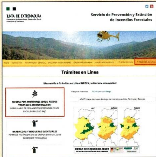
Imagen página http://www.infoex.info/tramites-en-linea/

Para tramitar las declaraciones responsables acceda a través de la página http://www.infoex.info/ en el apartado de trámites en línea.