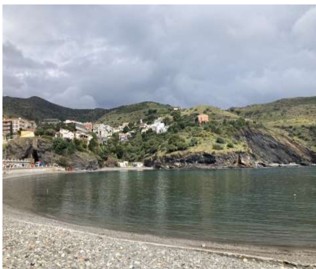
Foto 1. Platja del Racó

A continuació es presenta una mostra fotogràfica dels espais d'oci i de risc detectats: