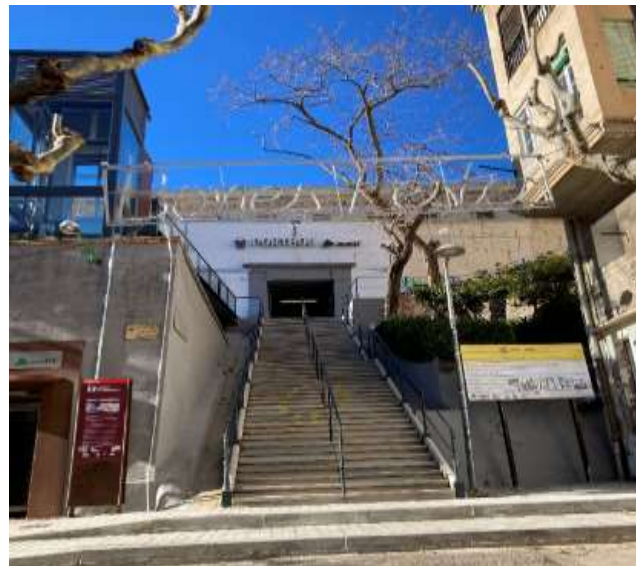
Foto 6. Estació de tren