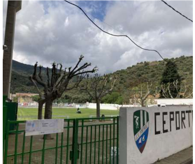
Foto 4. Zona del camp de futbol