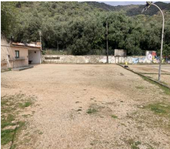
Foto 5. Zona de la petanca