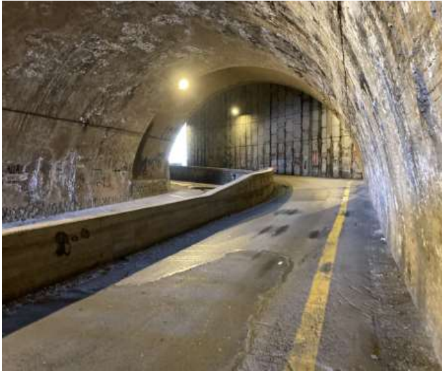
Foto 3. Zona de la riera de parking