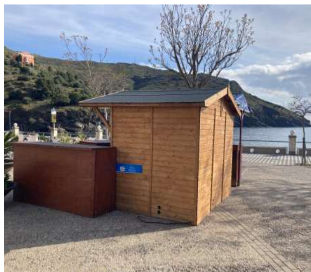
Foto 2. El xiringuito