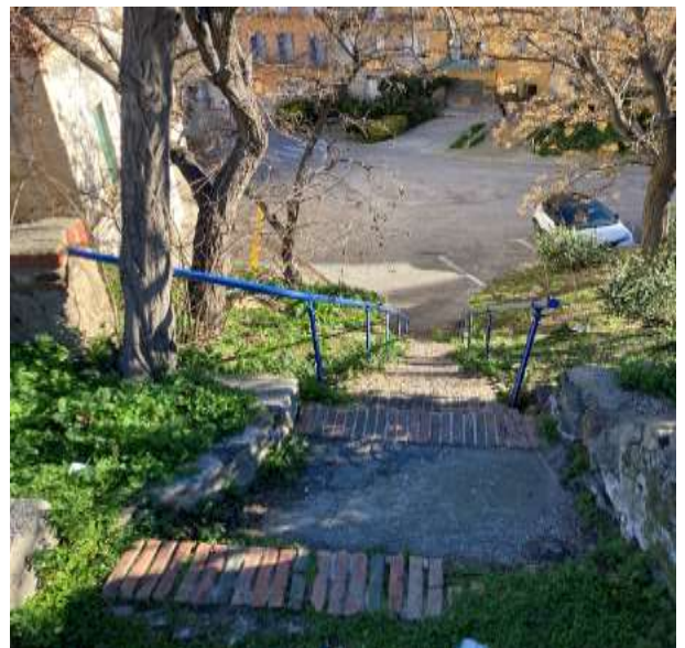
Foto 8. Escales davant estació de tren