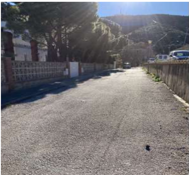
Foto 7. Carrer davant estació de tren