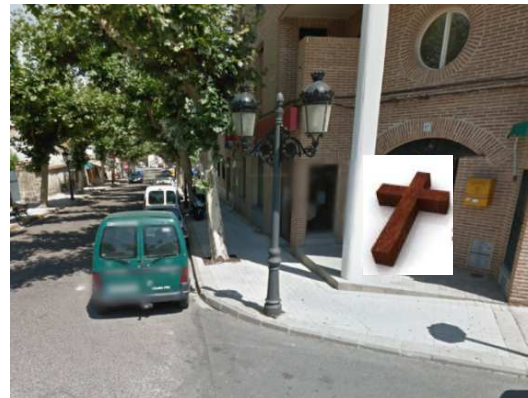
ESTACIÓN 6 - C/Real (CARMEN OLIVER)