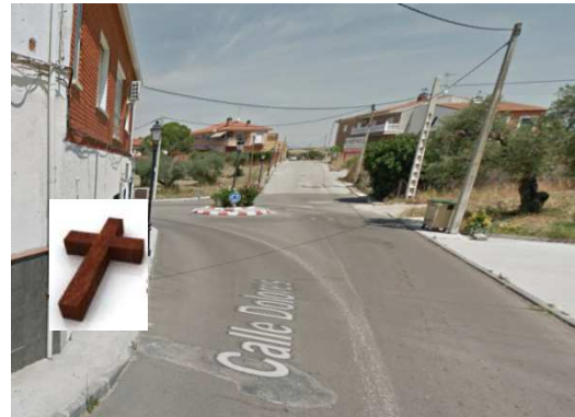
ESTACIÓN 4 - C/Dolores (EVELIO y MATILDE)