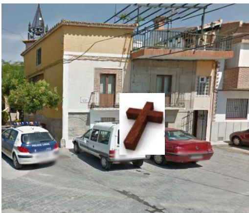
ESTACIÓN 7 - Plaza Constitución (CARMINA)