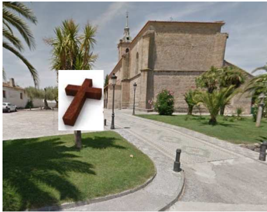
ESTACIÓN 1 - IGLESIA (en la cruz)