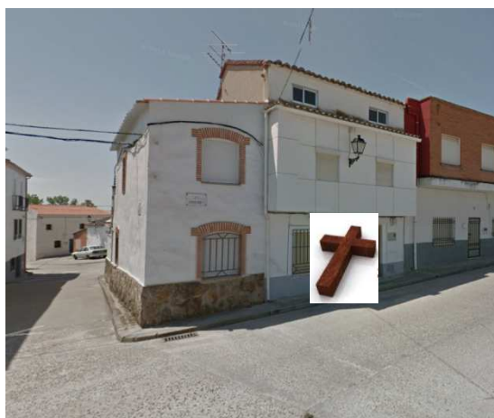
ESTACIÓN 10 - Plaza Concejo (KUBALA)