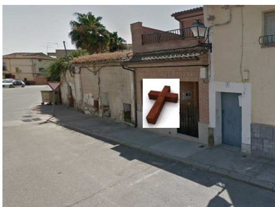
ESTACIÓN 11 – C/Cerrillo (AURELIA)