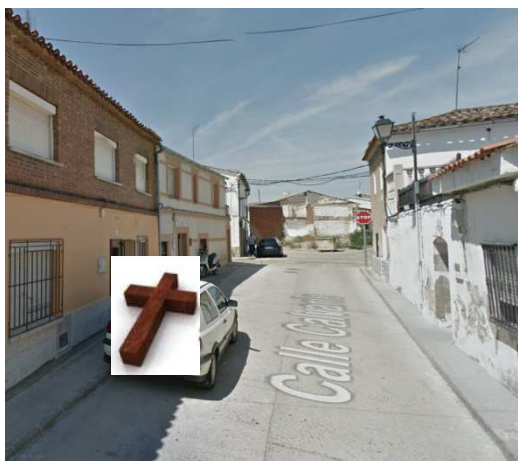
ESTACIÓN 9 – C/Calvario (PEPI DASILVA)