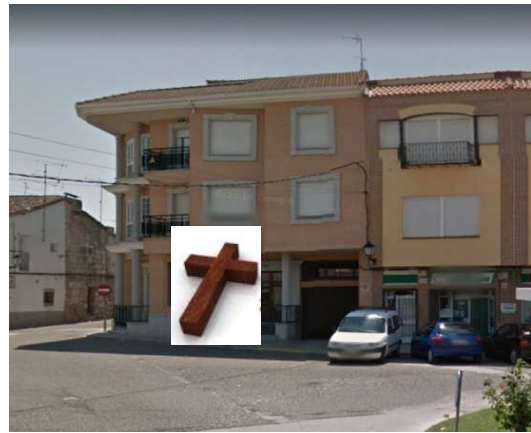
ESTACIÓN 2 - Pz del Rollo (PETRI)