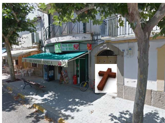
ESTACIÓN 12 - C/Real (ADELA)