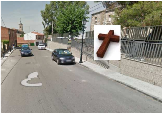
ESTACIÓN 5 - RESIDENCIA 3ª EDAD