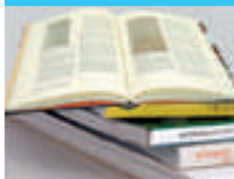
Imagen corporativa. Papelería corporativa. Archivadores. Carpetas. Sellos.