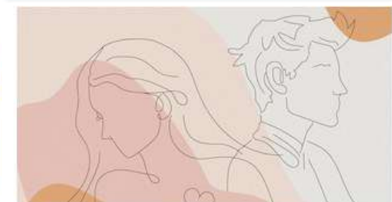
Asesoría afectivo-sexual para jóvenes

EL INSTITUTO ARAGONÉS DE LA JUVENTUD OFRECE A LA JUVENTUD ARAGONESA UN COMPLETO SERVICIO DE ASESORÍAS GRATUITAS.