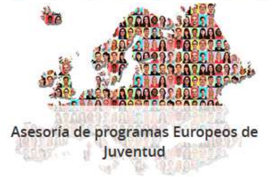
Asesoría de programas Europeos de Juventud