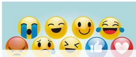
Asesoría de bienestar emocional para jóvenes