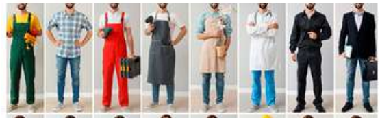
Asesoría de orientación laboral para jóvenes