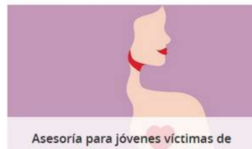
Asesoría para jóvenes víctimas de delitos sexuales

EL INSTITUTO ARAGONÉS DE LA JUVENTUD OFRECE A LA JUVENTUD ARAGONESA UN COMPLETO SERVICIO DE ASESORÍAS GRATUITAS.