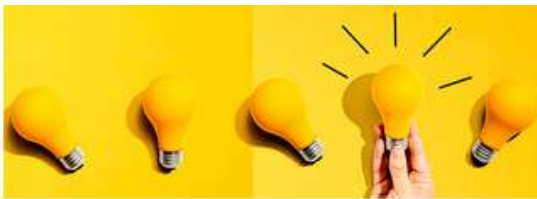
Asesoría fiscal y financiera para jóvenes emprendedores