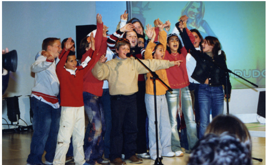
Viaje en avión con niños del D.P. Virgen de la Antigua 2003