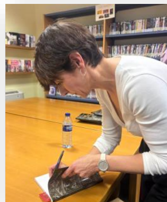
Presentación del libro “Pinturas de Pasión”