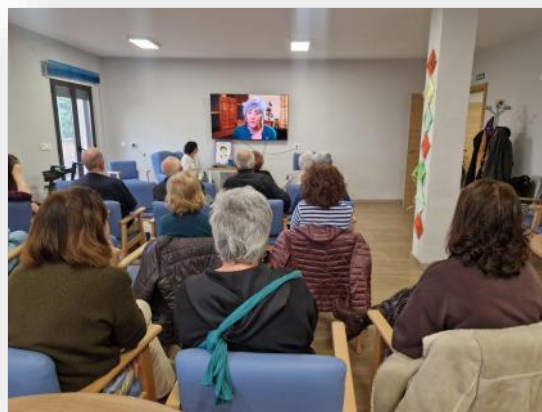
Conocemos a las SuperSegovianas en el Centro de Mayores