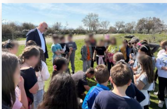
Plantación de árboles en las inmediaciones del municipio