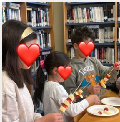
Súbete al tren de la alimentación saludable