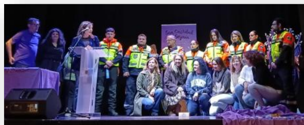
Entrega de los reconocimientos “Eres Igualdad”