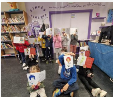
Conocemos a las SuperSegovianas en la Biblioteca