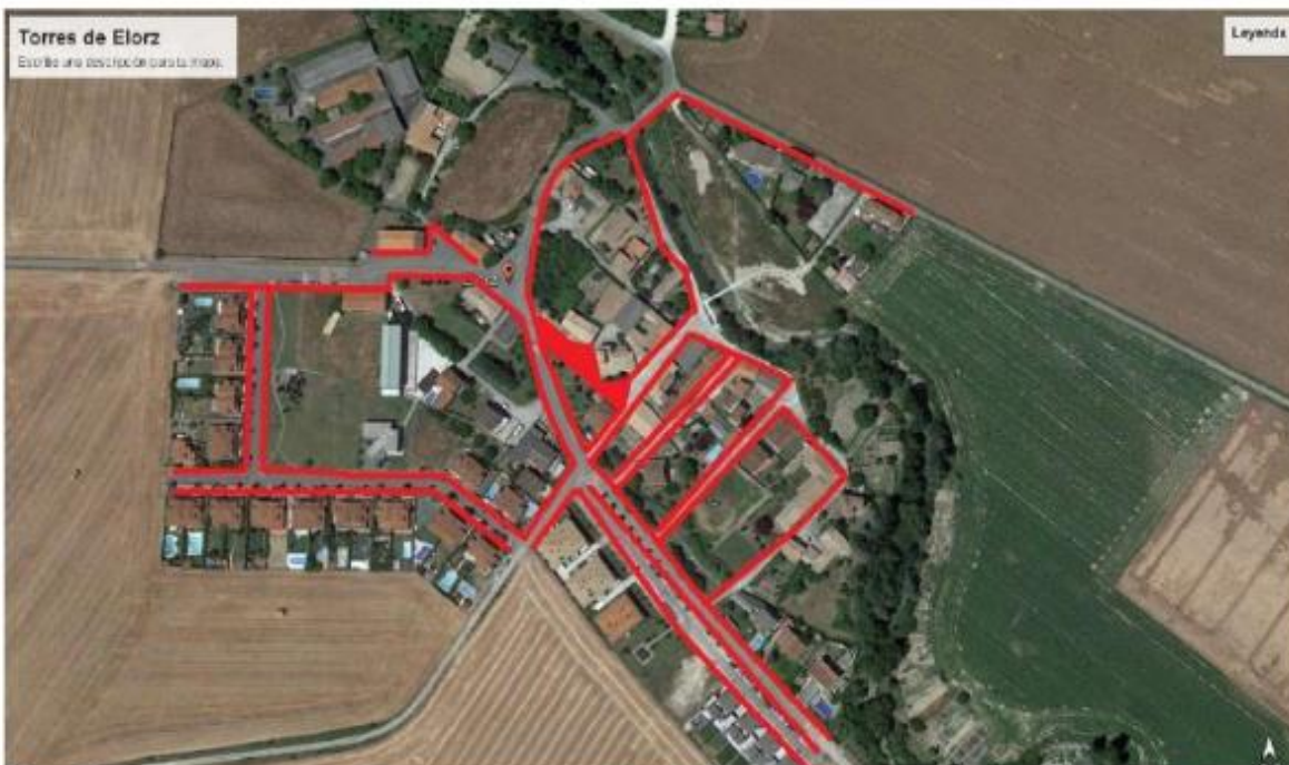
Torres de Elorz Este día una desinfección por la mañana