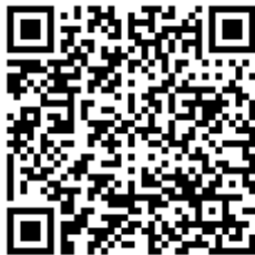
Código QR para validación en sede

Regulación CSV: Decreto 3628/2017 de 20-12-2017