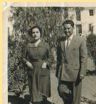
Ducenombre y Manuel